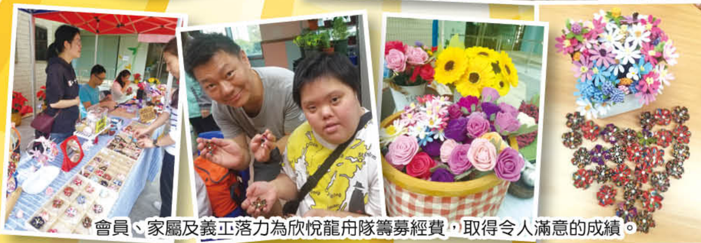
會員、家屬及義工落力為欣悅龍舟隊籌募經費，取得令人滿意的成績。