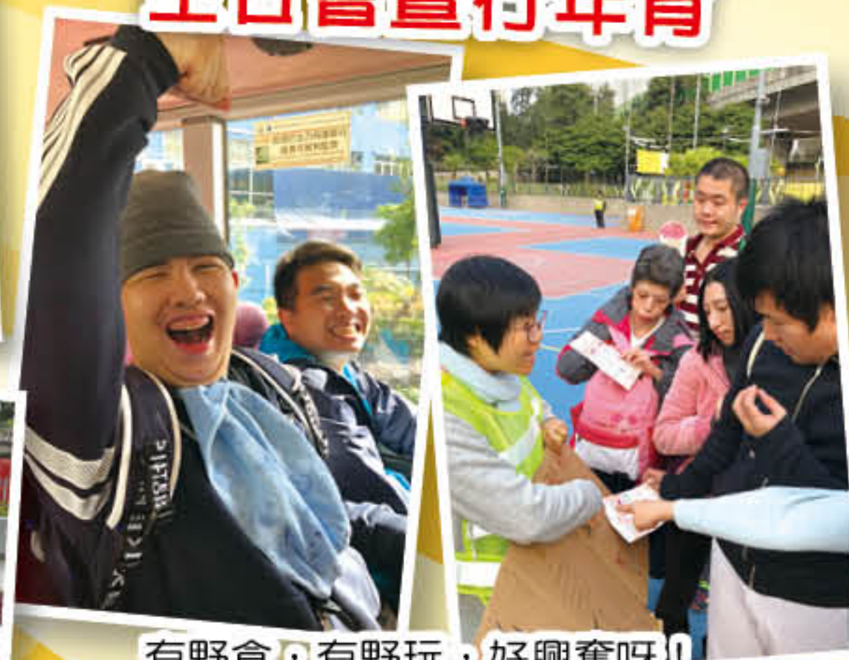
有野食，有野玩，好興奮呀！