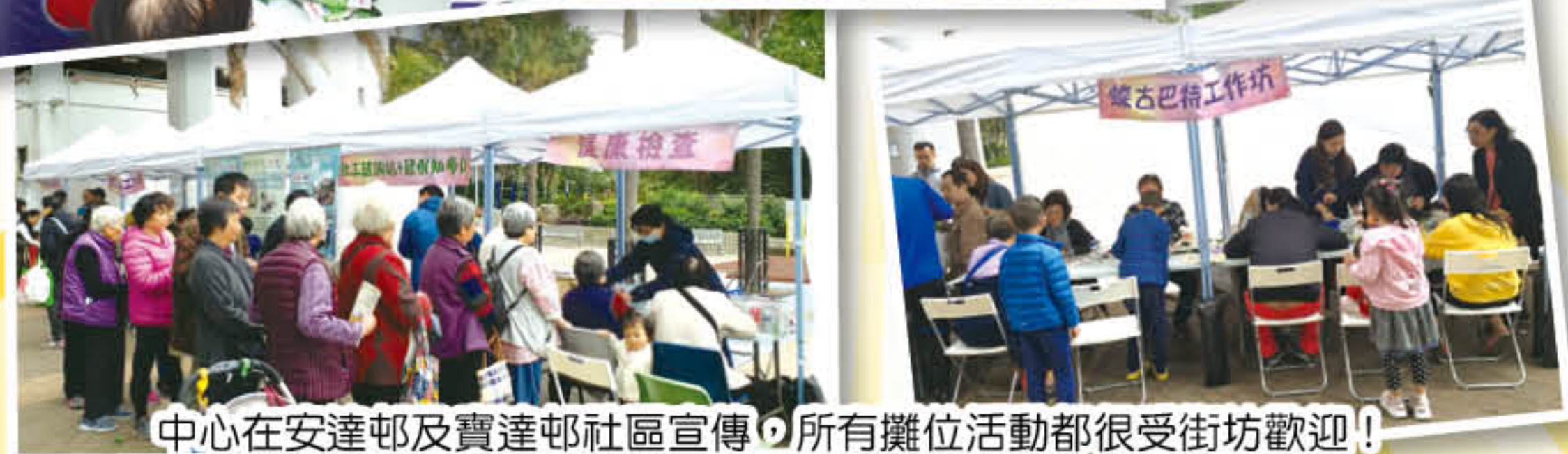
中心在安達邨及寶達邨社區宣傳，所有攤位活動都很受街坊歡迎！