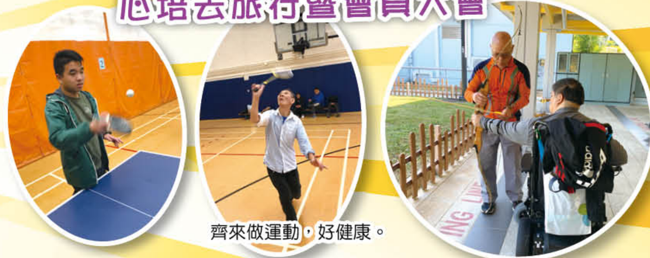
齊來做運動，好健康。