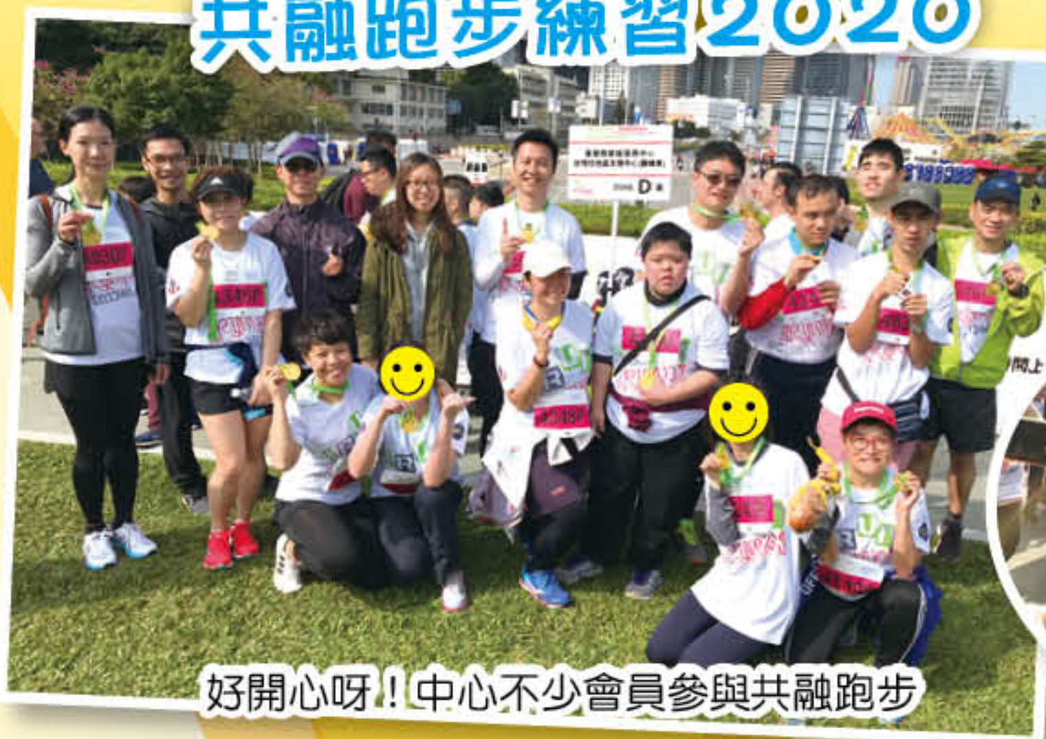
好開心呀！中心不少會員參與共融跑步